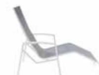
ALUMINIUM WHITE ALL WEATHER MOUSE GREY