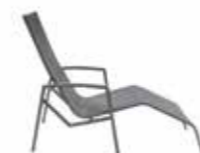
ALUMINIUM LAVA ALL WEATHER MOUSE GREY