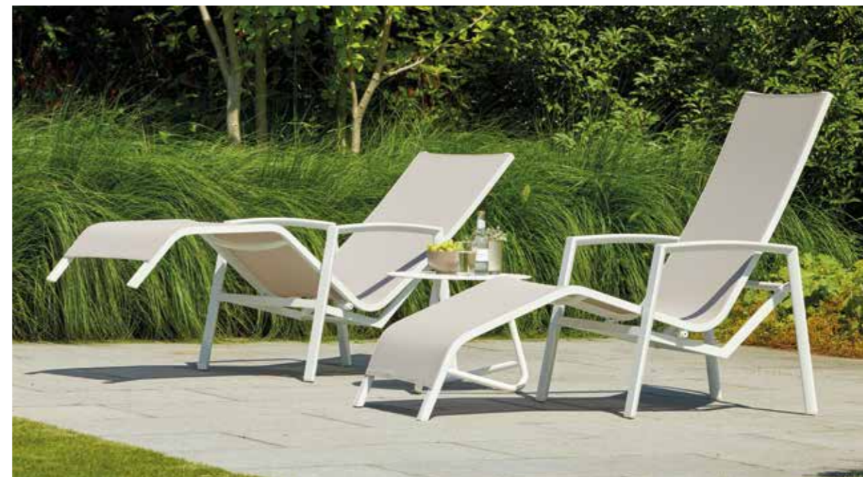
SPRING RELAX CHAIR W68 x D130 x H109 CM